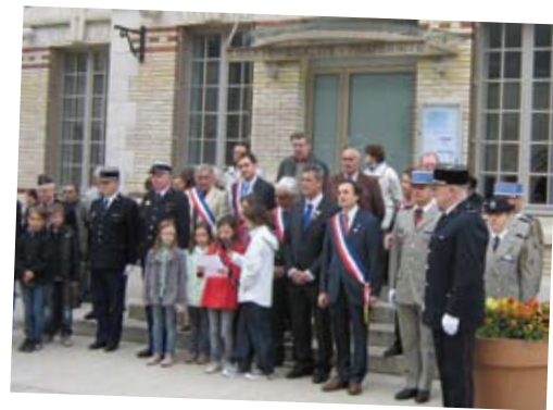
8 mai 2012 Commémoration