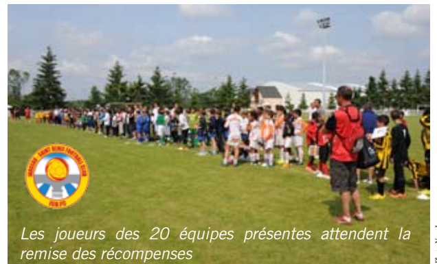
Les joueurs des 20 équipes présentes attendent la remise des récompenses

La réussite de ce tournoi ne peut passer que par le partenariat avec les deux municipalités pour le prêt des installations et du matériel, par les partenaires pour l'aide à la dotation et surtout par les 60 bénévoles présents sur les deux jours, que ce soit, dirigeants du club, arbitres (avec de nombreux jeunes des catégories U17 et U15 qui ont prêté main forte), parents des joueurs, que ce soit au