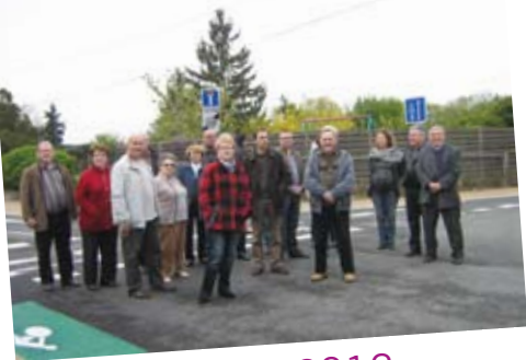
14 avril 2012 Inauguration rue de la Bâte et rue de la Croix des Barres