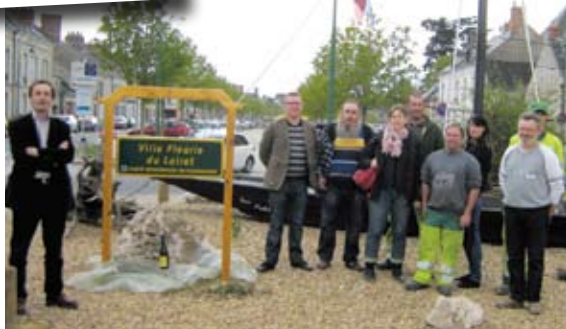
13 avril 2012 Inauguration panneau ville fleurie