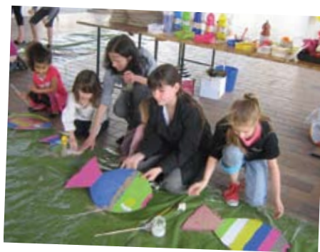
12 mai 2012 Les arts dans la rue