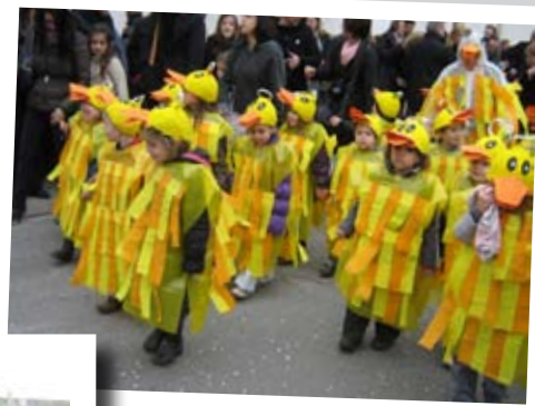
17 mars 2012 Carnaval de l'école maternelle