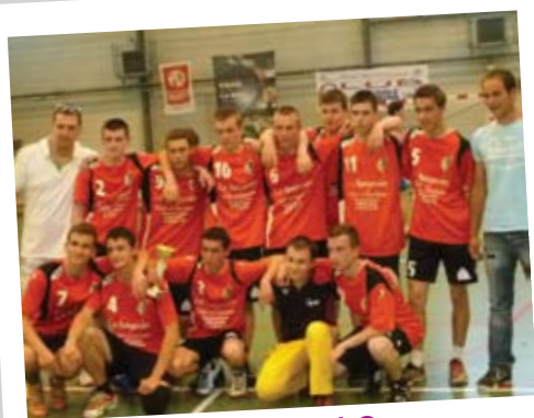
Juin 2012 Equipe de hand, garçons -18 ans, finalistes de la coupe du Loiret