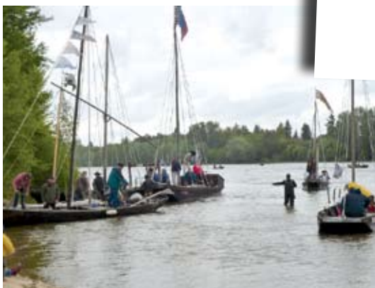
18 mai 2012 « La remontée du saumon »