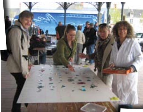
7 avril 2012 Forum 21 Action science