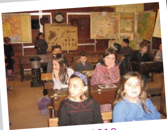
Mars 2012 ANEP Expo une classe des année 50